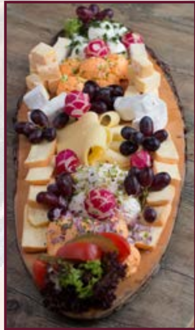
Abbildung Beispiel für 5 Pers. Holzbrettl ca. 90 cm lang