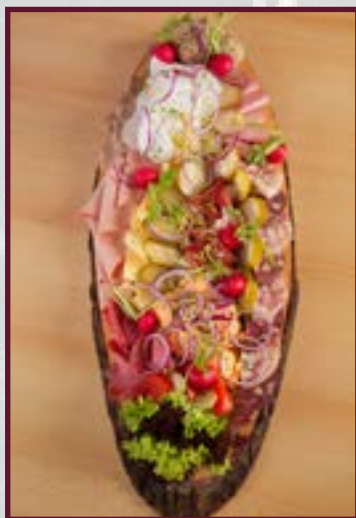
Abbildung Beispiel für 5 Pers. Holzbrettl ca. 90 cm lang