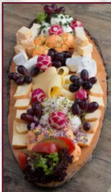
Abbildung Beispiel für 5 Pers. Holzbrettl ca. 90 cm lang