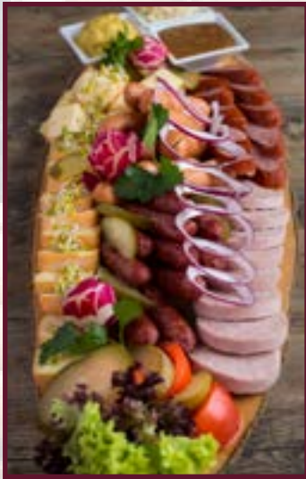
Abbildung Beispiel für 5 Pers. Holzbrettl ca. 90 cm lang